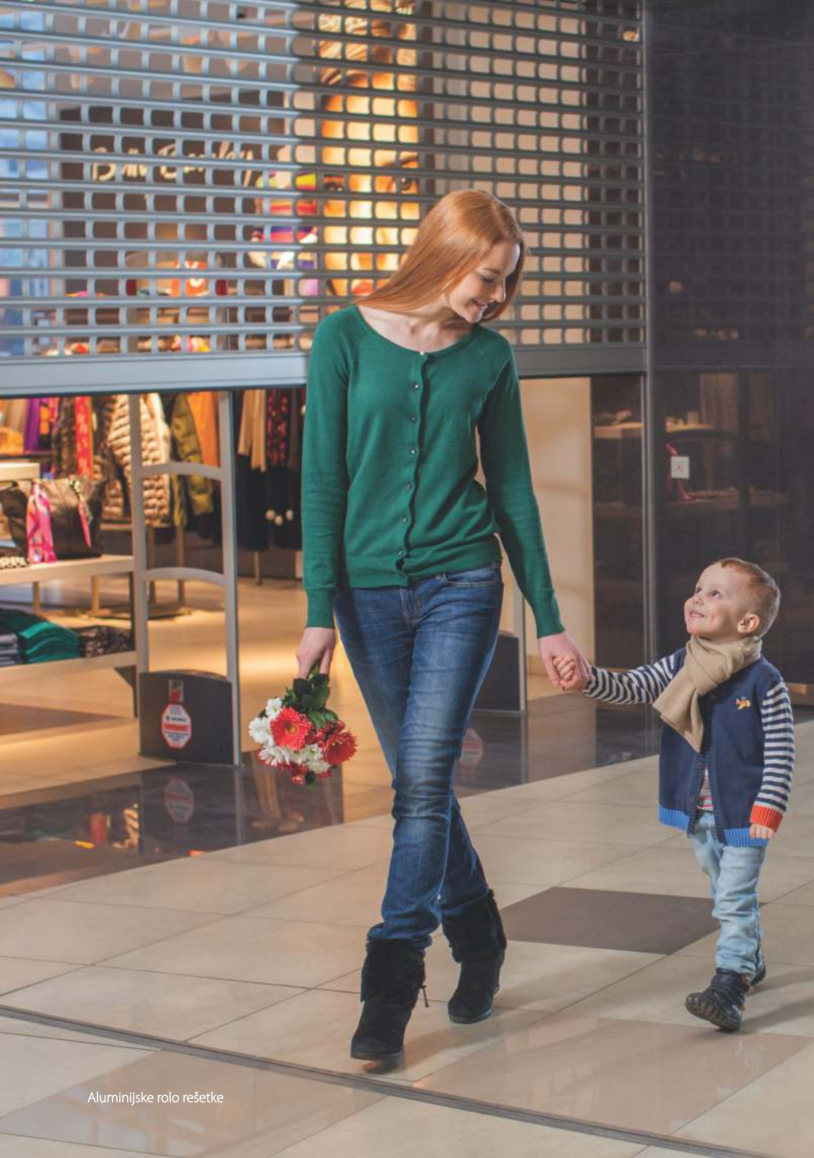
Aluminijske rolo rešetke